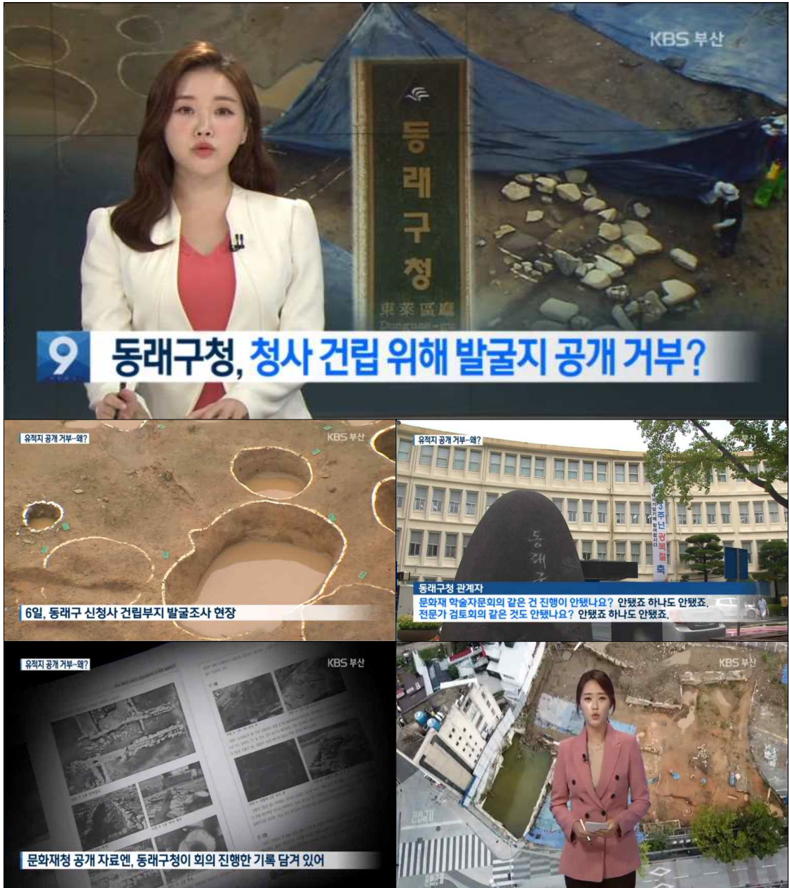
▲ KBS부산 <<뉴스9>> (8/11)

해당 기사 <동래구청, 청사 건립 위해 발굴 유적지 공개 거부?> 이도은 http://mn.kbs.co.kr/news/view.do?ncd=4514934