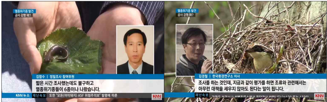
▲ KNN <<뉴스아이>> (8/12)

LH가 기존 계획대로 공사를 재개한 이유는 용역보고서 때문입니다. 보고서가 <양산사송 공공주택지구 조성사업 동·식물상 정밀조사 보고서>에 이번에 발견된 멸종위기종이 대부분 '이동성이 매우 큰 분류군'이라서 공사에 별 영향을 받지 않는다고 결론 내린 겁니다. KNN은 한국환경연구소 인터뷰를 통해서 이런 식이라면 (이동성이 큰) 조류에 대해서는 보호 고려를 할 필요가 없다는 이야기와 다를 바 없다고 비판했습니다. 보고서 용역업체가 협의 없이 보고서 종합결론을 내렸다고도 꼬집었습니다. 용역보고서 작성을 은밀하게 진행한 것에 의도는 없었는지, 왜곡의 정도는 어느 수준인지 철저히 점검해야 한다고 촉구했습니다.