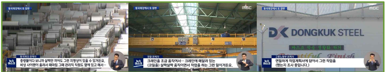
△ 부산MBC, 2/17

부산MBC는 <동국제강 또 사망 사고... '크레인 오작동' 추정>(17일, 3번째)으로 보도했습니다. 동국제강 관계자, 경찰 관계자, 고용노동부 관계자가 인터뷰어로 등장했고, 이중 수사를 담당하고 있는 경찰관계자의 추정을 리포팅 제목으로 뽑았습니다. KNN은 단신으로 <동국제강 공장서 코일에 낀 직원 숨져>(2/17)를, 국제신문은 <동국제강 부산공장서 또 노동자 사망사고>(2/18, 6면)를 전달했습니다.