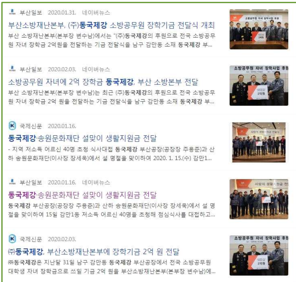
△ 2020년 1·2월 ‘동국제강’ 언급한 지역신문 기사

지난해 1월 13일 부산에서 발생한 동국제강 노동자 산재사망사고를 단 한 차례도 언급하지 않은 국제신문과 부산일보, 두 신문사는 동국제강 발 기부기사 2건은 모두 기사화했습니다.