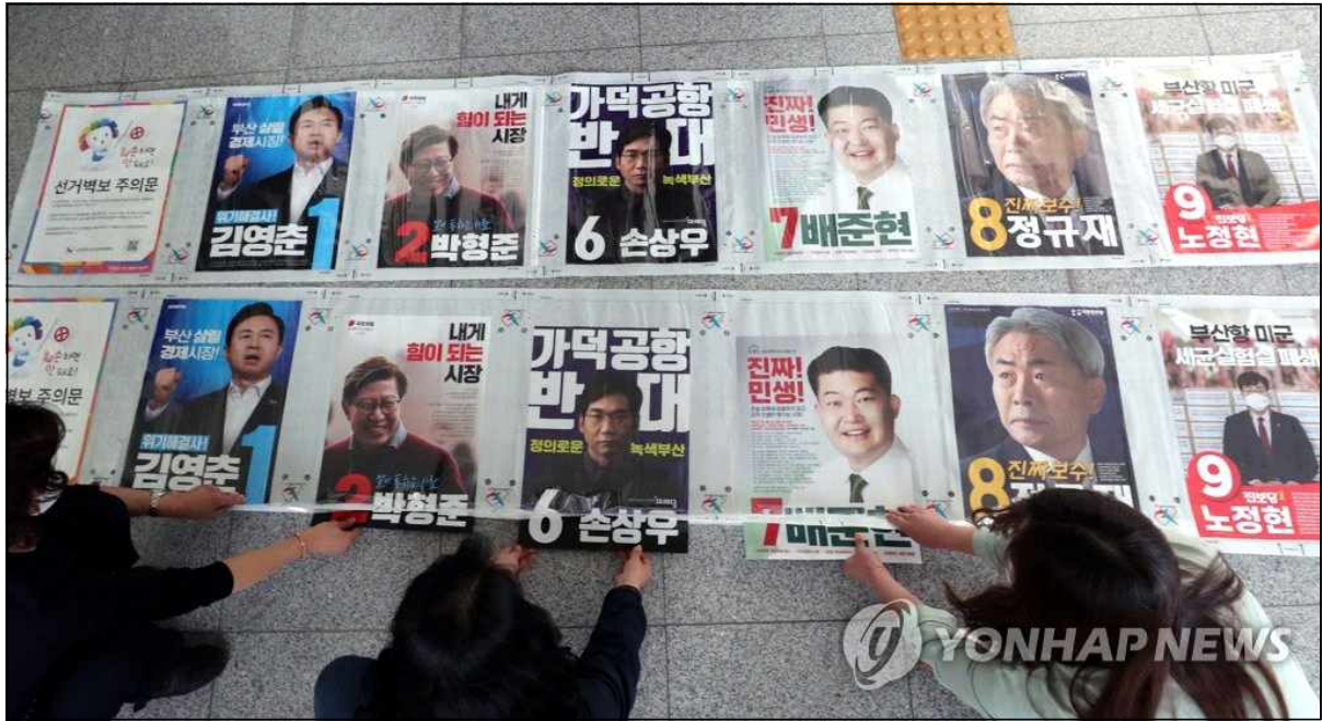
△ <부산시장 후보자들의 선거벽보>(연합뉴스, 3/24)

2020년 4월 23일, 부산시장이 사퇴했다. ‘집무실에서 직원 성추행’이 사퇴 사유였다. 그로 인해 치러진 4·7부산시장 보궐선거에 약 253억의 세금이 쓰였다. 전임 시장의 개인 일탈이라 치부하기엔 막대한 사회적 비용이었다. 무엇보다 시정 집무실이라는 공적 공간에서, 고위공직자인 시장에 의한 성추행은 개인 일탈이 될 수 없었다. 구조 점검과 함께, 재발 방지를 위한 정치권의 책임 있는 대책이 필요했다.