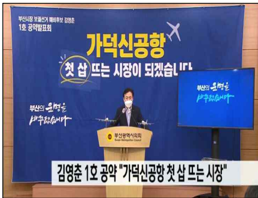
△ KNN, 1/21

성평등 선거가 가덕신공항 선거가 되는데 대한 가장 큰 책임은 정치권에 있다. 그 어느 선거보다도 이번 4·7부산시장 보궐선거에서 여성 대상 공약이, 성평등한 부산시를 위한 정책이 두드러질 수 있는 명분이 있었음에도 가장 앞서 제시된 공약은 가덕신공항과 어반루프였다.