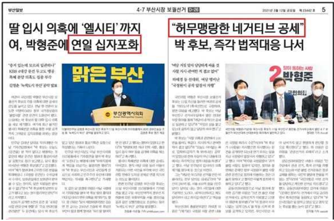
<그림 2> 부산일보 3월 12일 5면 박형준 의혹 공방 보도

3월 12일 국제신문 <여당, 박형준 사찰 연루의혹 문건 십자포화...朴은 법적대응 엄포>, 부산일보 <딸 입시 의혹에 '엘시티'까지 여, 박형준에 연일 십자포화>, <"허무맹랑한 네거티브 공세" 박 후보, 즉각 법적대응 나서>에서 국민의힘과 박형준 후보측의 '엘시티 특혜분양', '국정원 불법 사찰 문건', '딸 대학 입시' 관련 의혹을 여당이 제기하는 것에 대해 '십자포화를 퍼붓는다', '총 공세를 펼치고 있다'고 서술하고 있었다. 반면 박 후보측의 입장에 대해서는 이러한 의혹 제기를 제목에서부터 '허무맹랑한 네거티브 공세'로 규정하고, '거짓의 성', '어이없는 폭로', '갑툭튀 공