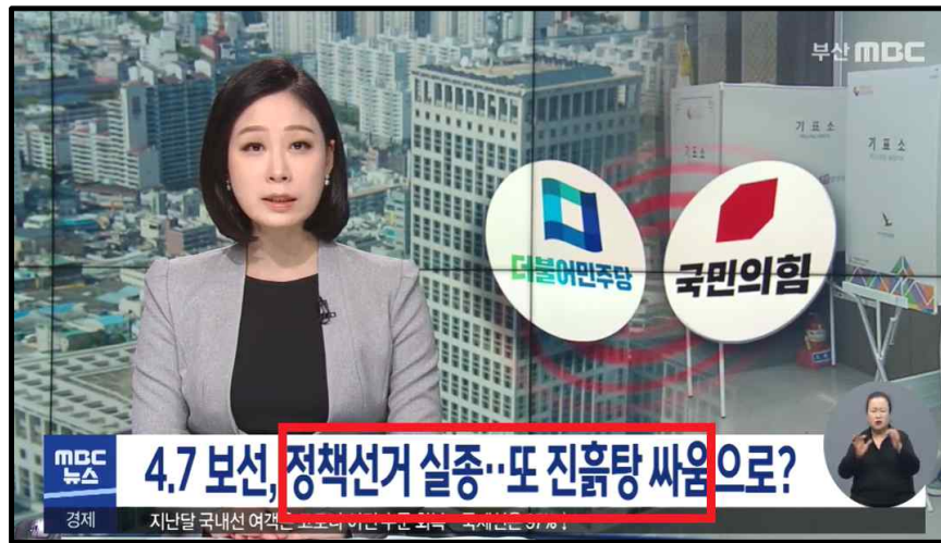
△ 부산MBC 3월 14일 정책선거 실종 우려 보도

또 국제신문 <여당, 박형준 겨냥 ‘닥치고 공격’…아직은 약발 안 먹혀>(3/17)는 박형준 후보에 대한 의혹제기를 민주당의 선거전략으로만 평가했다. 해당 기사는 ‘아직까지 민주당의 공세가 지역 민심에 먹혀들지 않는 모습’이라며 두 후보의 격차가 확대되고 있는 여론조사 결과가 그 근거라고 말했다. 후보검증과 여론조사 결과를 연결해 ‘약발 안 먹혀’와 같은 표현을 사용함으로써, 여론조사에 영향을 미치지 않는 후보 검증은 불필요하다는 인식을 보여줬다.