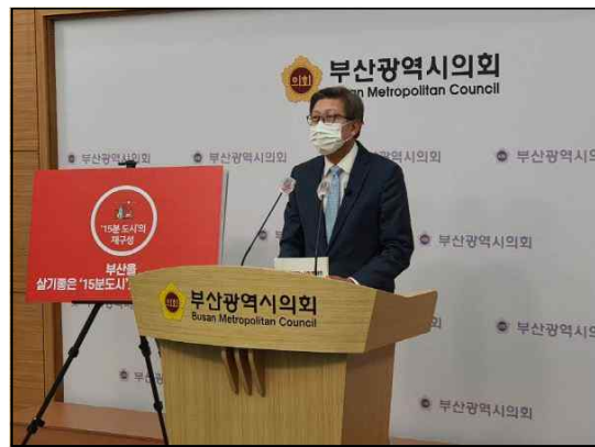
△ 국제신문, 12/28

좋은 선거보도는 좋은 정치와 어느 정도 궤를 같이한다. 후보가 네거티브 전략을 가지고 선거에 임하면, 이를 전달하는 선거보도 또한 공방과 정쟁으로 얼룩지게 되는 경우를 빈번하게 확인할 수 있다. 그렇기에 이번 선거보도에서 성평등 이슈가 실종된 데 대한 가장 큰 책임은 부실한 성평등 공약·정책으로 선거에 임한 정당·후보에 있다.