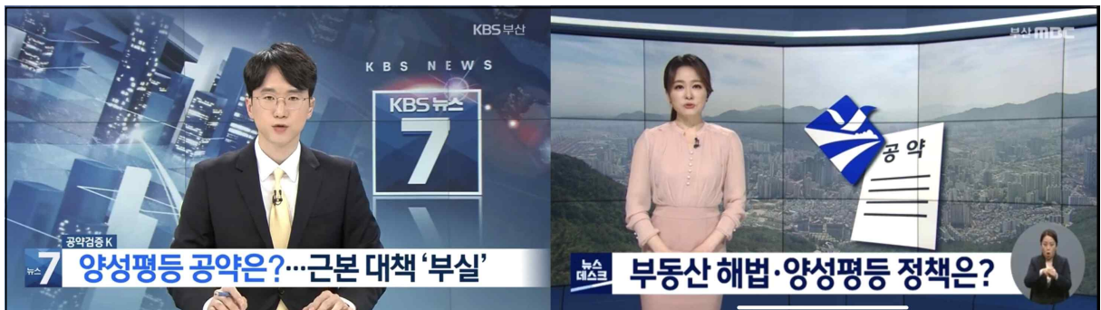
△ (좌) KBS부산(3/29), (우) 부산MBC(3/30)

다음 책임은 언론이다. 성평등 공약에 무심한 정치권을 검증하고 비판해 성평등 가치를 이번 선거의 주요 이슈로 견인해야 했음에도 지역언론은 이 역할을 하지 못했다. KBS부산은 '공약검증K', 부산MBC는 '공약대전' 선거기획에서 한 차례 후보 간 성평등 공약을 비교하는 데 그쳤다.