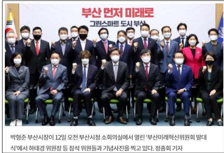
△ 부산일보, 4/13, 3면

성 평등 이슈가 실종된 선거가 성 평등 이슈가 실종된 부산시정으로 귀결되는 모양새다. 지난 4월 20일, 박형준 부산시장과 부산시 고위공무원은 ‘직장 내 성희롱·성폭력’을 근절하겠다는데 서약하고 피해자의 빠른 일상 회복 지원을 약속했다. ‘오거돈 성추행’으로 드러난 부산시정의 문제는 분명 개인의 서약과 약속만으로 변화를 기대하기 어렵다. 박형준 시장이 후보시절 약속한 성 평등 관련 공약이행에서부터 성 평등한 부산시정을 만들어 나갈 수 있게, 이를 지역언론이 잘 견인해 주길 당부한다.