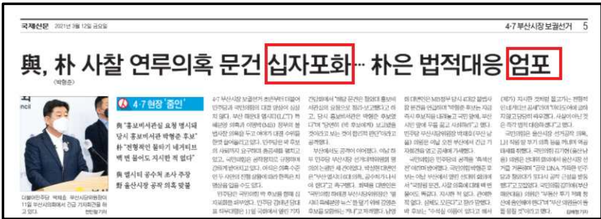
<그림 1> 국제신문 3월 12일 5면 박형준 국정원사찰 의혹 공방 보도