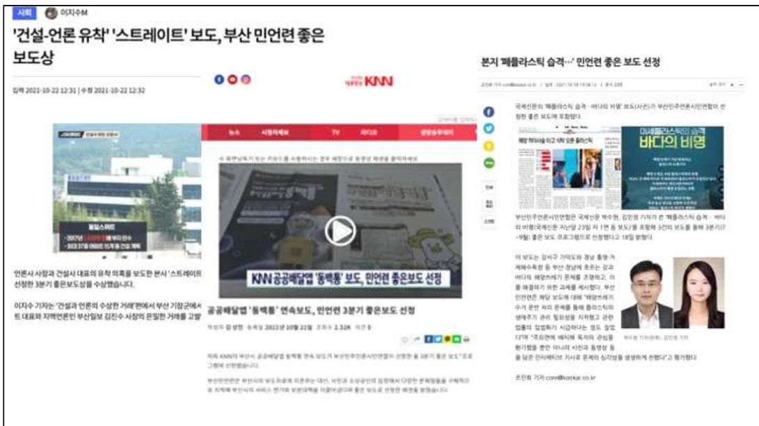
△ 2021 3분기 좋은 보도·프로그램 선정작 기사 갈무리