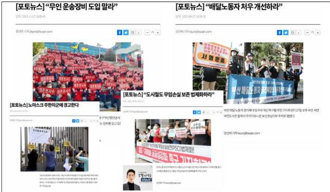
△ 부산일보 포토뉴스 중 '노동이슈' 관련 기사 갈무리

노동 이슈를 단신, 사진기사로만 다루는 것은 독자나 시청자에게 노동이슈의 가치가 그 정도의 크기로만 전해지고 있을 가능성이 크다. 그렇기에, 소위 '그림이 되겠다' 싶은 장면을 좇아 노동이슈를 기사화 하기 보다는 기자회견, 파업을 통해 공론화 하고자 하는 메시지에 주목해 보도해야 한다.