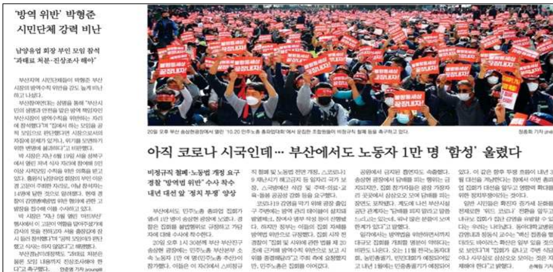
△ 부산일보 박형준 시장 방역위반 기사(좌), 1020노동자총파업 방역위반 기사(우)

뜯어보기 보고서로 나오진 않았지만, 박형준 부산시장의 방역지침 위반 사건에 대해 지역언론은 비판하지 않았다. 이는 부산참여연대와 부산민주언론시민연합이 공동으로 낸 성명 '방역지침 위반과 거짓 해명하는 박형준 부산시장, 부산시 방역 책임질 수 있나'에서 확인할 수 있다.