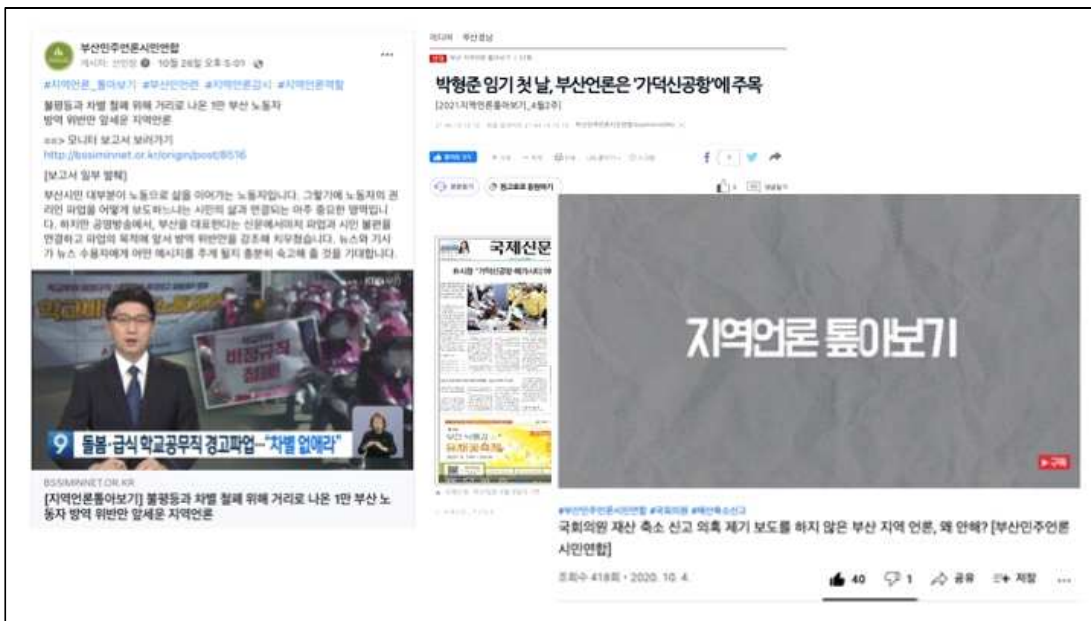
△ 페이스북, 오마이뉴스, 유튜브 화면 캡처 갈무리

2020년부터 시행한 ‘부산민언련이 선정한 분기별 좋은 보도 프로그램’은 2014년부터 이어온 ‘부산민주언론상’과 함께 지역의 좋은 보도를 독려하기 위한 장으로 자리매김하고 있으며, 지역언론도 수상 소식을 기사화 하는 등 그 영향력을 키워가고 있다.